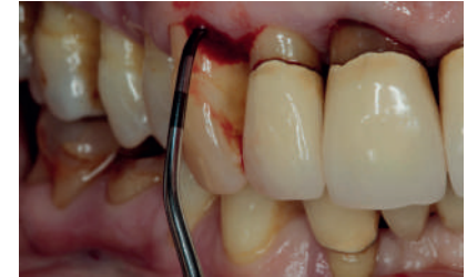
DS1CN auf einen Frontzahn.