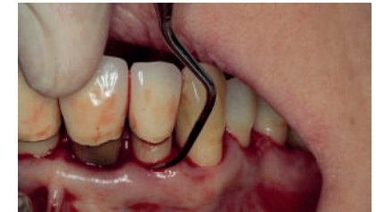
DS1CN auf der bukkalen Oberfläche eines Frontzahns.

„Ich konnte mir erst nicht vorstellen, vom großen Gracey Satz auf nur zwei Küretten zu reduzieren... aber jetzt möchte ich keine PAR-Behandlung mehr ohne meine DSS Küretten durchführen! Sie sind optimal gewinkelt, absolut atraumatisch und die Zeitersparnis ist sensationell.“