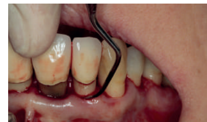
DS1CN sur la surface buccale d'une dent antérieure.