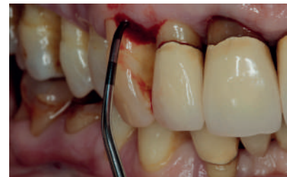
DS1CN sur une canine.